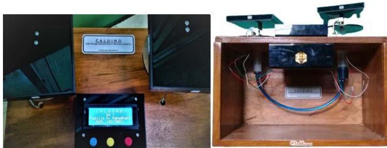
Gambar 3. Alat peraga Hukum Pascal