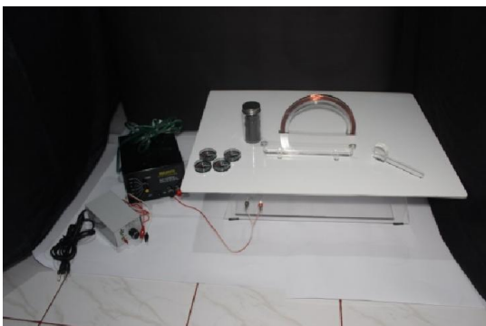
Gambar 2 Perangkat Eksperimen Induksi Magnetik pada Kawat Melingkar.

Dalam proses pembuatan alat eksperimen peneliti mengalami beberapa kegagalan, salah satunya dalam pembuatan meja perangkat. Semula meja perangkat terdiri dari dua lapis akrilik bening dan memiliki rongga untuk serbuk besi, agar saat lilitan kawat melingkar dialiri arus listrik pola-pola medan magnet dapat langsung terlihat. Pembuatan meja perangkat eksperimen seperti ini menyebabkan serbuk besi tidak dapat menyebar merata, hal ini menyebabkan pola medan magnet yang terbentuk tidak terlihat jelas. Sehingga harus dilakukan pembuatan ulang untuk meja perangkat dengan menghilangkan rongga untuk serbuk besi dan akrilik bening diganti dengan akrilik putih agar pola medan magnet dengan serbuk besi dapat terlihat lebih jelas.