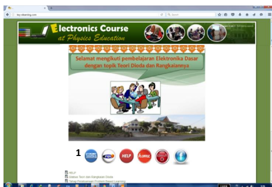
Gambar 1. Tampilan untuk mengakses silabus.

Berdasarkan hasil penelitian yang telah dilaksanakan diperoleh suatu perangkat perkuliahan yang dapat diakses secara online sebagaimana Gambar 1 yang menunjukkan ikon untuk mengakses silabus perkuliahan topik teori dan rangkaian dioda yang ditandai dengan kode angka 1.